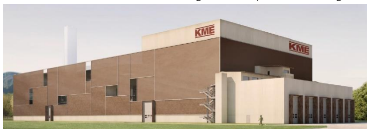
Figura 2. Piattaforma energetica KME