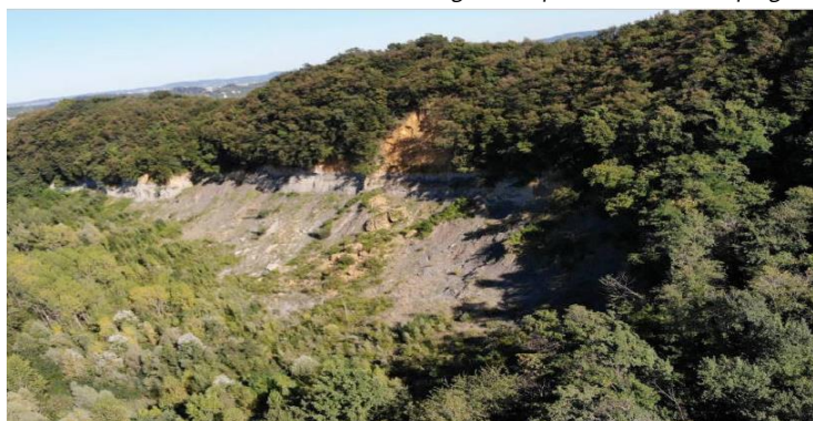
Figura 2. Area di Frana Cava Fagarè