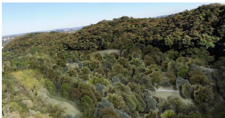
Figura 3. Progetto di Ripristino