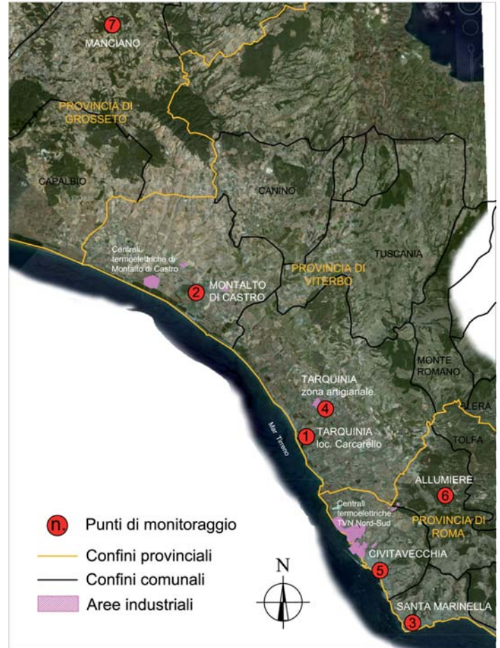
Localizzazione delle stazioni di monitoraggio sul territorio.

Data la mancanza di dati locali aggiornati ed esaustivi inerenti i livelli di inquinamento eventualmente presenti sull'area in questione, è stata organizzata e pianificata una campagna di monitoraggio mobile di qualità dell'aria.