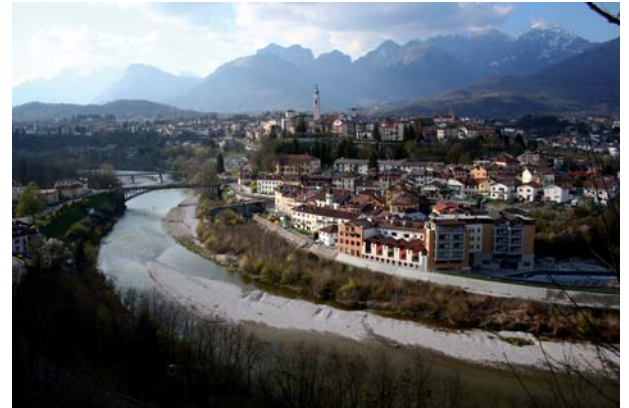
Il Piave presso Belluno

D'intesa con l'Amministrazione provinciale di Belluno è stato definito il Documento preliminare propedeutico al Progetto Strategico del fiume Piave, ossia un indirizzo metodologico per il futuro governo territoriale del fiume, con il quale è stato iniziato un percorso di riflessione condivisa tra i portatori di interesse locali.