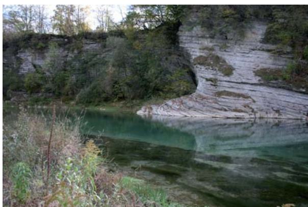
La forra sul Piave

Lo scopo è quello di suggerire e affrontare una modalità operativa di sviluppo e gestione del processo strategico di governo sul fiume, coerentemente con quanto disposto dalla Direttiva europea 2000/60 in materia di acque. L'idea-forza proposta per il governo del fiume è quella di passare dalla monofunzionalità cumulativa insostenibile alla multifunzionalità integrata e sostenibile, ipotizzando uno scenario di amministrazione sul fiume unica e condivisa, che minimizzi i conflitti ambientali.