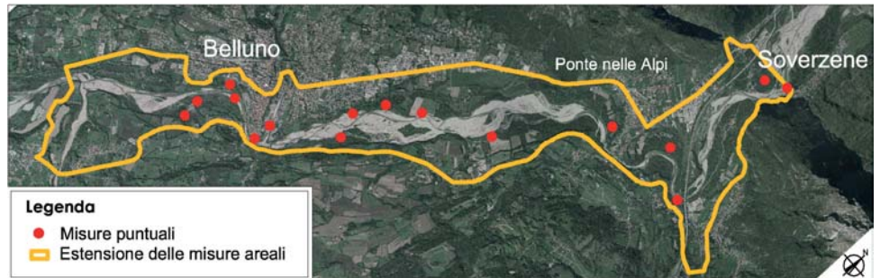
Planimetria di sintesi delle ipotesi di progetto

Il Progetto Pilota del fiume Piave è l'applicazione pratica dell'indirizzo di metodo proposto dal Documento preliminare propedeutico al Progetto Strategico del fiume Piave. Si tratta della prima sperimentazione concreta di un processo partecipato di pianificazione, progettazione e gestione sul fiume Piave in