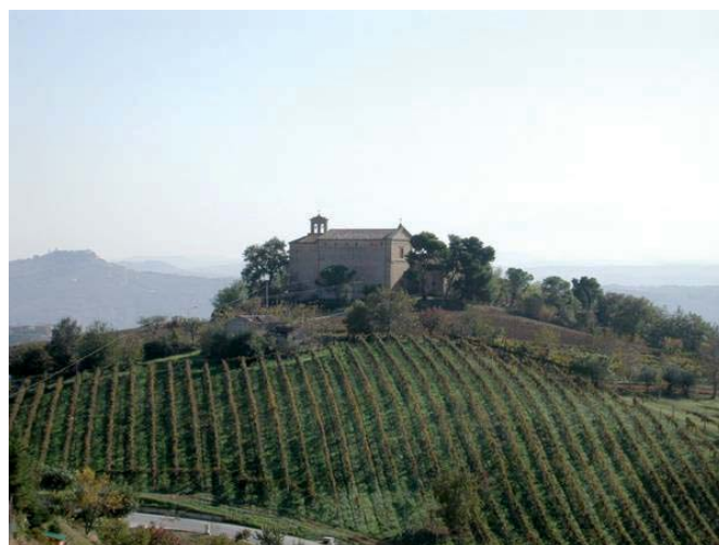
Paesaggio del comune di Acquaviva Picena

L'oggetto della presente procedura di valutazione è costituito dal progetto di ristrutturazione e realizzazione di nuova edificazione, ai sensi delle Linee Guida Regionali per la Valutazione Ambientale Strategica.