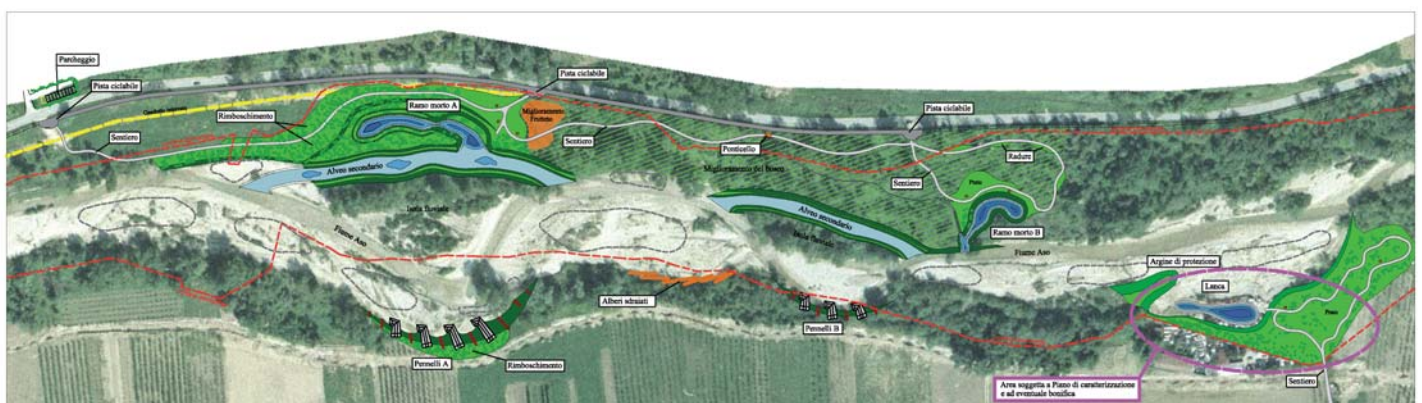
Planimetria di progetto