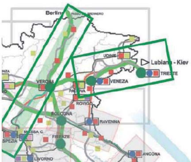
Piafformata territoriale nord - orientale