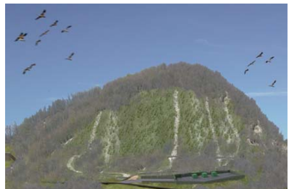
Area di intervento: fotomontaggio sistemazione finale