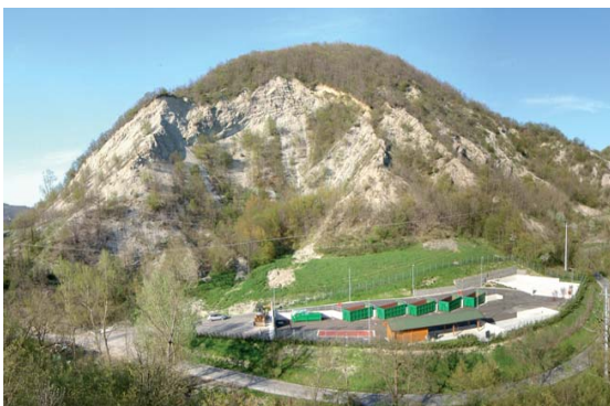
Area di intervento: stato attuale