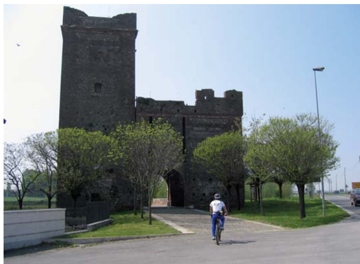
Tratto di pista ciclabile nel comune di Isola della Scala

La progettualità è orientata verso interventi di tipo multifunzionale, volti sia alla realizzazione di un più agevole e sostenibile sistema di spostamento intra-urbano ed extra-urbano, sia alla valorizzazione e riqualificazione del territorio (con particolare riferimento all'ambito fluviale), del suo peculiare patrimonio ambientale nonché di quello storico-culturale, artistico ed enogastronomico. Le piste ciclabili progettate rappresentano un volano promozionale al territorio che esse attraversano, rappresentando l'occasione di valorizzazione delle varie attrattive presenti.